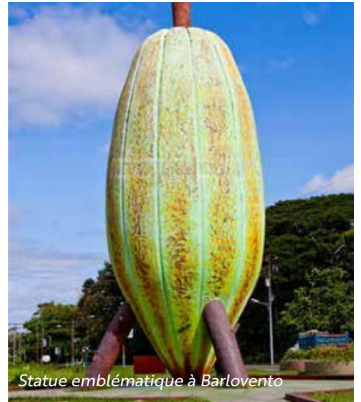
Statue emblématique à Barlovento